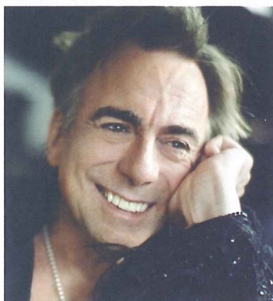
Rikard Wolf medverkar i Inte en främling .

Bland de medverkande finns stå upp-komikern och författaren Zinat Pirzadeh med rötterna i Iran, europaparlamentarikern Soraya Post, drivande för romernas sak, den judiske skådespelaren och artisten Rikard Wolff, och transpersonen